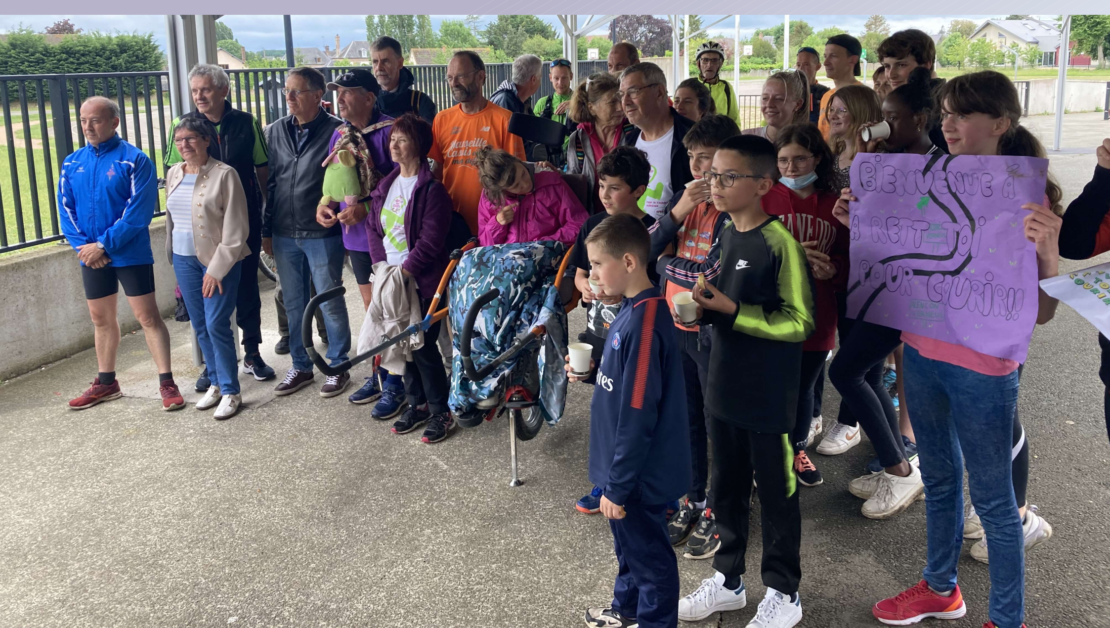
Photo souvenir de cette magnifique arrivée, grâce à une mobilisation incroyable des collégiens, leurs professeurs, les pompiers et le club de course à pied de VERNEUIL-SUR-AVRE !