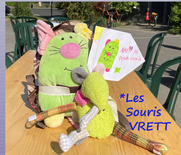
*Les Souris VRETT