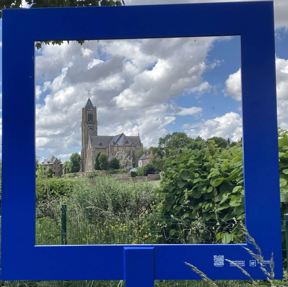
* Passage à WARNETON côté Belge