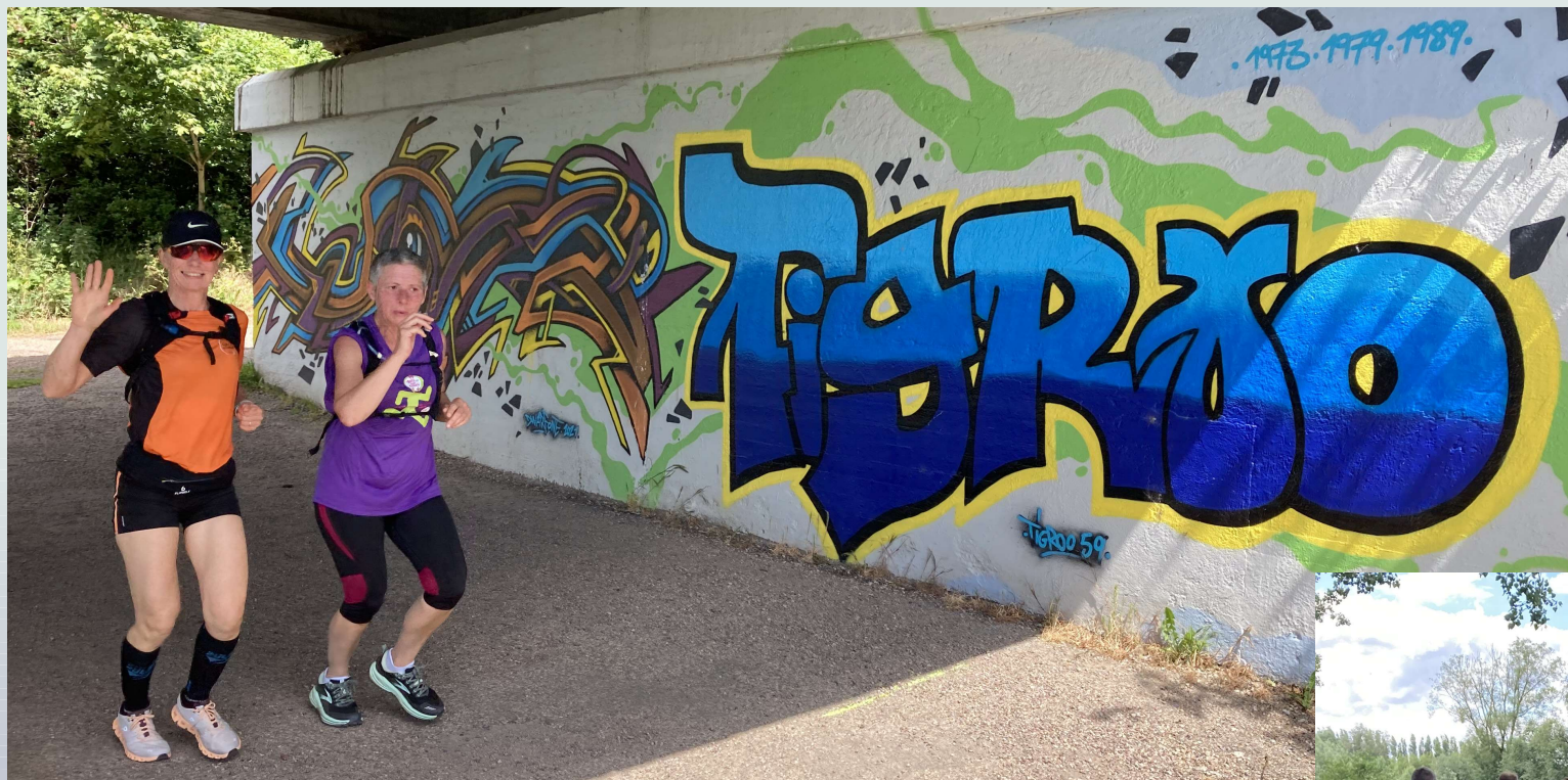
*Passage sous un pont de FRELINGHIEN avec de beaux dessins de Street Art.